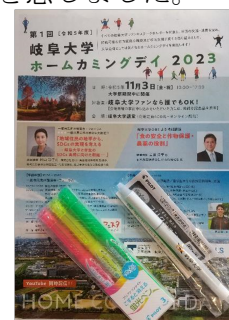
参加記念品 フリクション蛍光ペン

しかし、卒業後40年ぶりに岐阜を再訪して、金華山や長良川を近くから眺め、神輿行列の貴重な映像を見ることができ充実していた岐阜大学生の時代を思い出ことができました。大学祭の模擬店や展示をしている多くの学生に接し同窓生としての一体感が少し芽生えた気がします。今回は、時間の制約で学生生活の最後を過ごした那加方面へは行くことができませんでしたが、いずれ時間を作って出かけてみたいと思っています。