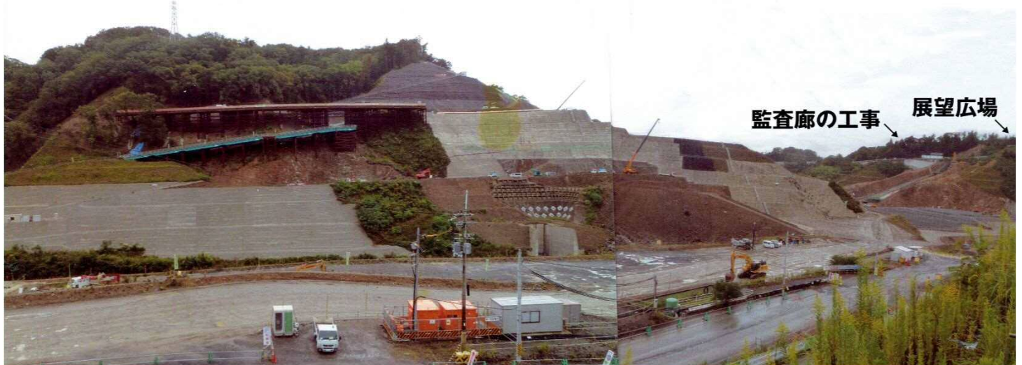
↑ 現場事務所より望む